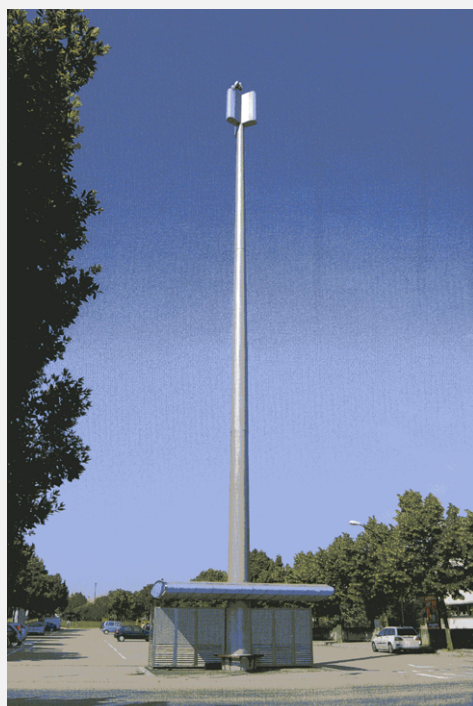
Zone Neutre Installazione di antenne su palo con elementi per la mimetizzazione