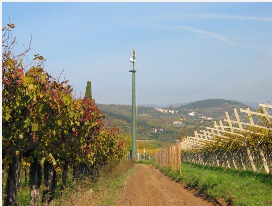
Zone Neutre Installazione di antenne su palo mimetizzato