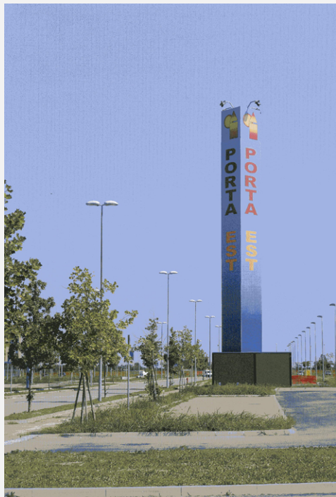
Zone Neutre Installazione di antenne su palo mimetizzato