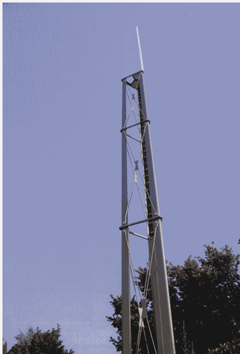
Zone Neutre Installazione di antenne su palo costituente arredo urbano