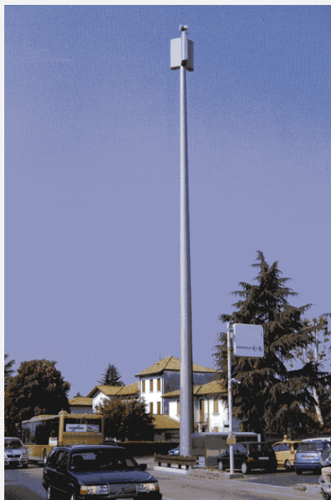
Zone Neutre Installazione di antenne su palo con elementi per la mimetizzazione