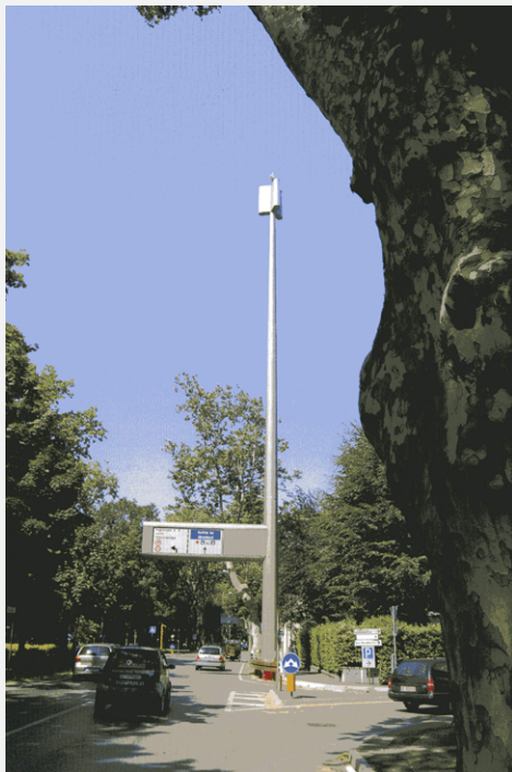
Zone Neutre Installazione di antenne su palo con elementi per la mimetizzazione