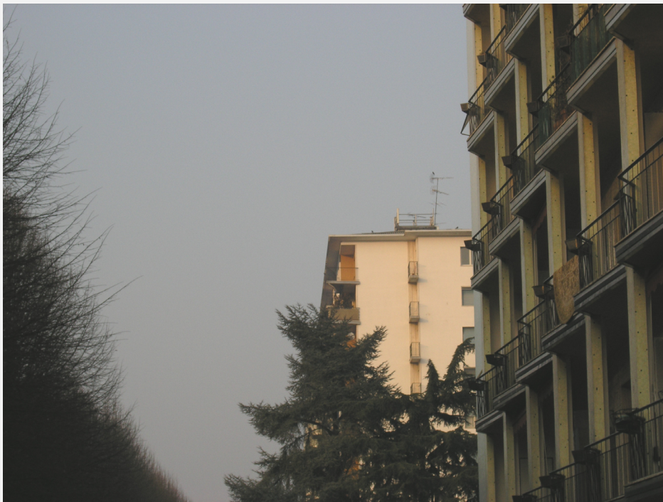
Zone di Installazione Condizionata Impianto non sporgente dal colmo o da altri corpi edilizi esistenti per più di 4,50 m