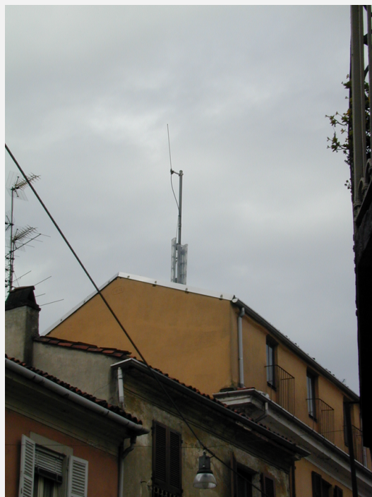
Zone di Installazione Condizionata Impianto non sporgente dal colmo o da altri corpi edilizi esistenti per più di 4,50 m e mimetizzazione