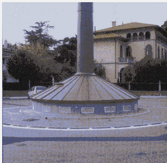
Zone Neutre Shelter mimetizzato