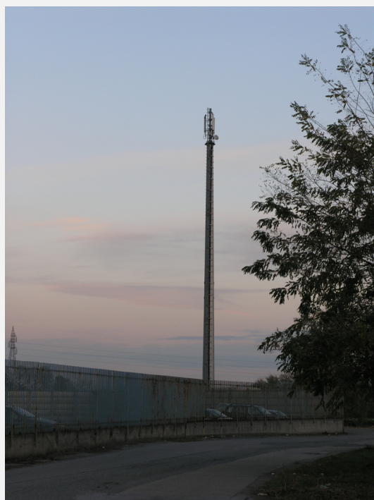
Zone Neutre Installazione di antenne su palo e co-siting