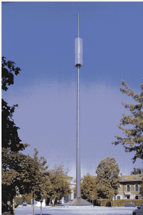
Zone Neutre Installazione di antenne su palo costituente arredo urbano